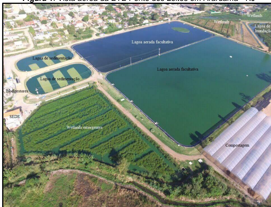
Figura 1. Vista aérea da ETE Ponte dos Leites em Araruama - RJ

O esgoto bruto transportado por caminhões à ETE é encaminhado para os biodigestores. Costuma chegar com carga orgânica entre 1000 a 2000 DBO (Demanda Bioquímica de Oxigênio), reduzida entre 70 a 75% nesta etapa inicial do processo anaeróbico. Esta fase é necessária para equalizar o efluente antes de entrar na estação; caso o volume fosse descarregado diretamente na estação, causaria impacto muito grande pois o ciclo ecológico de depuração da matéria orgânica seria mais lento, com necessidade de uma maior área para tratar a quantidade recebida por fitopurificação. A ETE também recebe as águas pluviais e esgoto diretamente da rede coletora do município, em